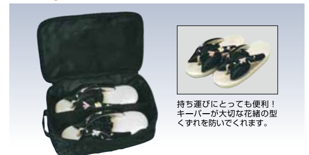
NO.605 いろいろポーチ 表生地/ナイロン100% 裏生地/ナイロン100% 色/リエーション/2 サイズ/約40×31cm 中国製 参考上代 ¥4500(税込 ¥4950)