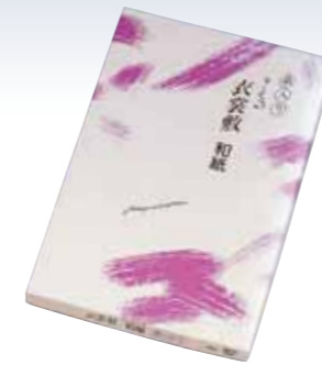
NO.613 衣裳敷 糸入り 使用素材/本体(ワルプ100%) 中糸(ビニロン10番単糸) サイズ/約100×180cm パッケージ/化粧箱入り 参考上代 ¥1800(税込 ¥1980)

洋間や外出先での着付けは、汚れが心配。 そんなときにこんな衣裳敷があれば、 大切な着物をほこりや汚れから守ります。