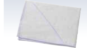
NO.612 衣裳敷 ハーフ 使用素材/ワルプ100% サイズ/約100×75cm 参考上代 ¥700(税込 ¥770)

従来のハーフサイズで、かさばらず に携帯でき、白のバイアスで慶弔 どちらにもOKです。