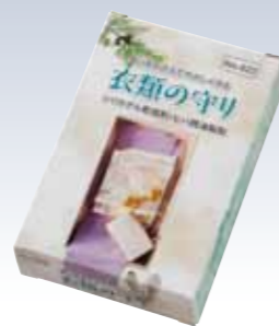
NO.622 衣類の守り 成分/乾燥剤(シリカゲル) 防虫剤(ヒバ(精油製剤)) 有効期間/防虫剤として開封後約半年 パッケージ/3袋入り 参考上代 ¥800(税込 ¥880) ※タンスの引き出し、衣裳箱1つに2~3袋 お入れ下さい。防虫効果がなくなりましたら 乾燥剤としてお使いください。

ヒバ製油の効果で防虫。 防虫剤独特の臭いがしないので、 大切な着物に臭い移りの心配なし。