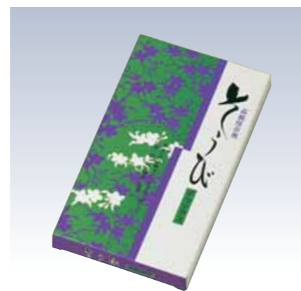
NO.668 保存剤そうび(10シート入) NO.669 保存剤そうび(4シート入) 成分/防虫剤(エンペントリン)・防カビ剤(チモール) 調湿剤(ゼオライト) 有効期間/開封後約半年 流通梱包数/4シート(20×4)・10シート(30) 参考上代 設定なし ※防虫防カビ能力に除菌・脱臭能力をプラス。 無臭保存剤であり、衣服にいやなにおいがつ きません。引き出し又は衣裳箱1つに1シート の割合でお使いください。