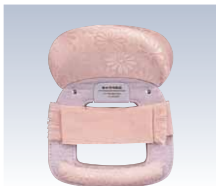
NO.630 教材用姿 表生地/レーヨン100% 頭部芯/ウレタン 胴体部芯/ボール紙・PVC枠 裏生地/レーヨン100% 紐部/レーヨン100% サイズ/約24×18.5cm 参考上代 ¥3200(税込 ¥3520)

お太鼓部分を、この結帯具にセットすることで、帯を手早く結ぶことができます。帯にやさしく、また基本的な変わり結びも結べます。