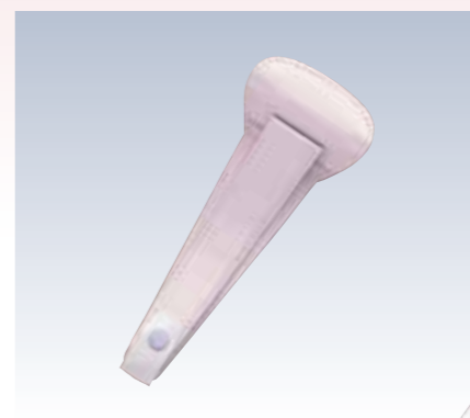
NO.64 止金 ワンタッチ 表生地/レーヨン100% 芯/スチール・ボール紙 裏生地/レーヨン100% サイズ/約22×8.5cm 流通梱包数/10 参考上代 ¥800(税込 ¥880)