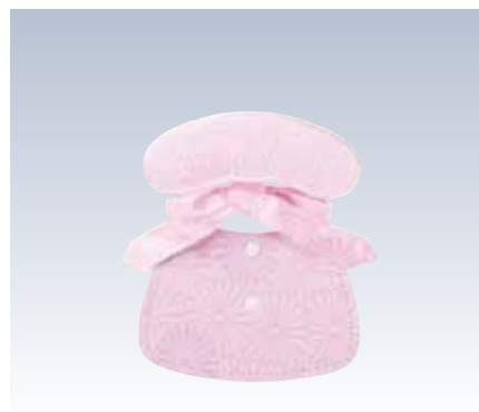
NO.10 サザメ 表生地/レーヨン100% 頭部芯/サンテックフォームポリエチレン 胴体部芯/ボール紙・スチール芯 裏生地/レーヨン100% 紐部/レーヨン100% サイズ/約17×13.5cm 参考上代 ¥1200(税込 ¥1320) ※半巾帯用