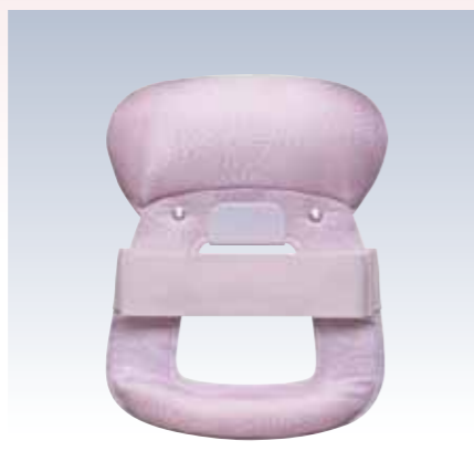
NO.8 ニュー姿 表生地/アセテート100% 頭部芯/ウレタン 胴体部芯/ボール紙・竹・PVC枠 裏生地/レーヨン100% 紐部/ポリエステル100% サイズ/約24×19cm 参考上代 ¥2900(税込 ¥3190)