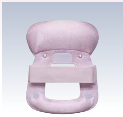
NO.9 下割姿 表生地/アセテート100% 頭部芯/ウレタン 胴体部芯/ボール紙・竹・PVC枠 裏生地/レーヨン100% 紐部/ポリエステル100% サイズ/約24×19cm 参考上代 ¥3200(税込 ¥3520)