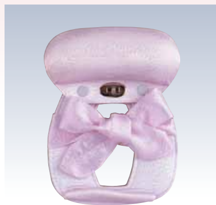
NO.5 M姿 表生地/レーヨン100% 頭部芯/ウレタン 胴体部芯/ボール紙・竹・ミラーマット 裏生地/レーヨン100% 紐部/レーヨン100% サイズ/約26×20cm 参考上代 ¥3000(税込 ¥3300)

通常の帯結びと違い、お太鼓部分をあらかじめ結帯具にセットして結びます。着付教室で初歩の教材として使われる商品で、後ろに手が上がりにくい方にもお薦めです。帯にやさしく、ふくら雀などの基本的な変わり結びもできます。