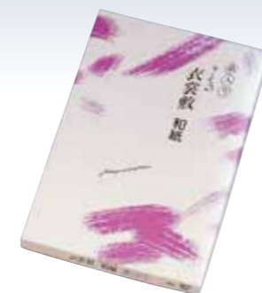
NO.613 衣裳敷 糸入り 使用素材/本体(ワルプ100%) 中糸(ビニロン10番単糸) サイズ/約100×180cm パッケージ/化粧箱入り 参考上代 ¥1800(税込 ¥1980)

洋間や外出先での着付けは、汚れが心配。 そんなときにこんな衣裳敷があれば、 大切な着物をほこりや汚れから守ります。