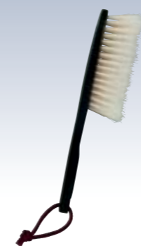
NO.649 きものブラシ(静電気除去) 使用素材/豚毛・静電気除去繊維混毛 柄/ABS樹脂 サイズ/約21×5cm パッケージ/紙箱入り 参考上代 ¥1700(税込 ¥1870) 静電気除去繊維が持つコロナ放電の働きで、 着物に帯びた静電気を取り除き、吸い付いて いたホコリを取りやすくなります。また、先端は 天然毛(豚毛)を残した特殊な植毛で、着物の 生地にやさしいブラッシングが可能です。