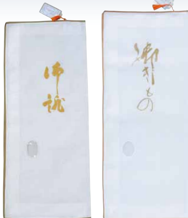
NO.607 保存袋(並) 使用素材/レーヨン100% サイズ/約90×38cm 中国製 参考上代 ¥1000(税込 ¥1100)