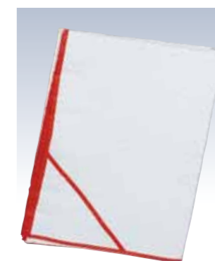
NO.661 衣裳敷 竹W 使用素材/ワルプ100% サイズ/約200×150cm 参考上代 ¥2000(税込 ¥2200)