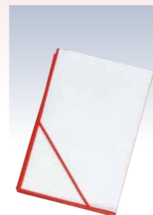
NO.609 衣裳敷 梅 使用素材/コーティング樹脂ポリエチレン 不織布レーヨン60%ポリエステル40% サイズ/約100×150cm 参考上代 ¥1800(税込 ¥1980)