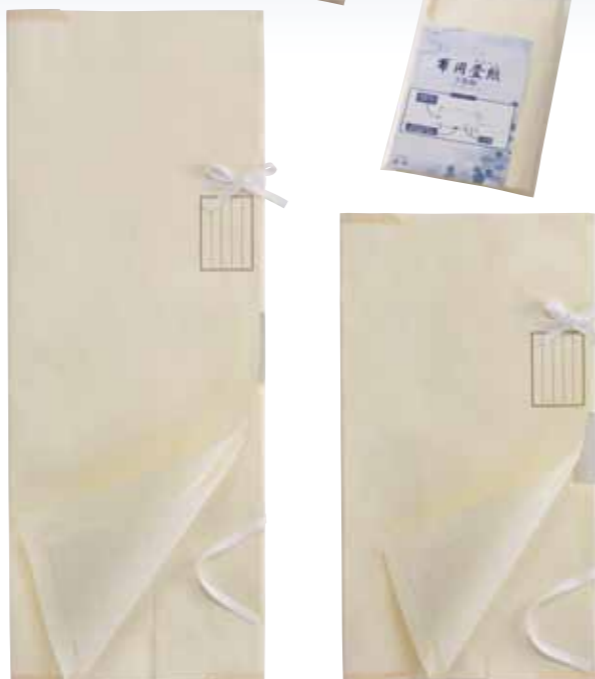
従来品より5cm丈長の長尺タイプ NO.707 きもの畳紙(3枚組) サイズ/約92×36cm 参考上代 ¥1800(税込 ¥1980)