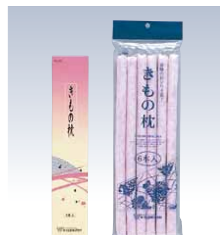
大切なお着物の折りジワを防ぎます。 NO.703 きもの枕(3本入) パッケージ/化粧箱入り NO.704 きもの枕(6本入) パッケージ/バック入り 使用素材/表生地(ポリエステル100%)・中芯(ポリエステル100%) サイズ/約34×1.8cm 中国製 参考上代 3本入/¥1200(税込 ¥1320) 6本入/¥2200(税込 ¥2420)