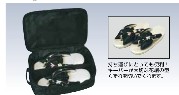
NO.605 いろいろポーチ 表生地/ナイロン100% 裏生地/ナイロン100% 色/リエーション/2 サイズ/約40×31cm 中国製 参考上代 ¥4500(税込 ¥4950)