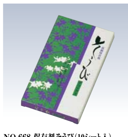
NO.668 保存剤そうび(10シート入) NO.669 保存剤そうび(4シート入) 成分/防虫剤(エンペントリン)・防カビ剤(チモール) 調湿剤(ゼオライト) 有効期間/開封後約半年 流通梱包数/4シート(20×4)・10シート(30) 参考上代 設定なし ※防虫防カビ能力に除菌・脱臭能力をプラス。 無臭保存剤であり、衣服にいやなにおいがつ きません。引き出し又は衣裳箱1つに1シート の割合でお使いください。