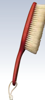
NO.659 和装ブラシ小 使用素材/豚毛 柄/ブナ材 サイズ/約24.5×3.5cm パッケージ/紙箱入り 参考上代 ¥3000(税込 ¥3300)