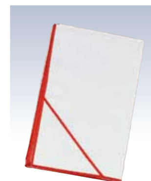
NO.611 衣裳敷 竹 使用素材/ワルプ100% サイズ/約100×150cm 参考上代 ¥1000(税込 ¥1100)