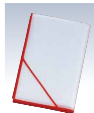
NO.614 衣裳敷 菊 使用素材/ポリエステル100% サイズ/約100×150cm 参考上代 ¥1700(税込 ¥1870)