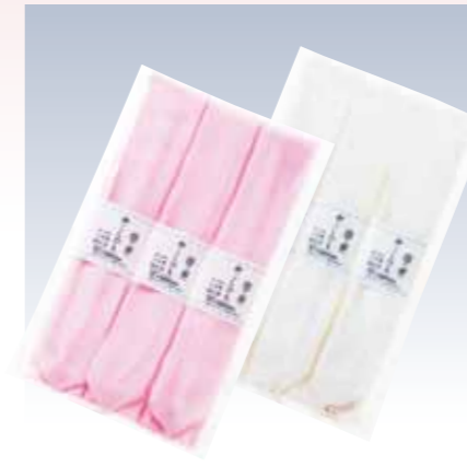
NO.358 本モス腰紐 広幅 (3本入) 素材/毛100% 色/リエーション/2 サイズ/約5×210cm 参考上代 設定なし