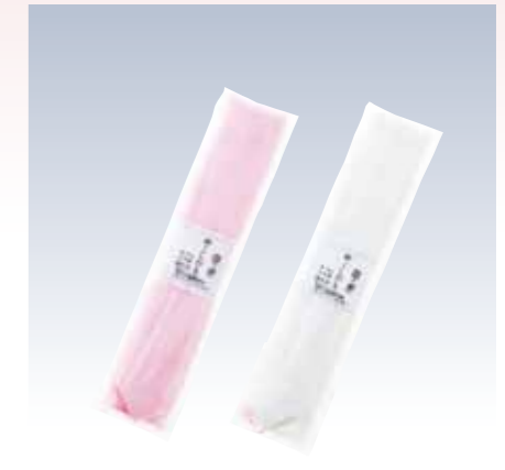
NO.365 本モス腰紐 広幅 (1本入) 素材/毛100% 色/リエーション/2 サイズ/約5×210cm 参考上代 設定なし