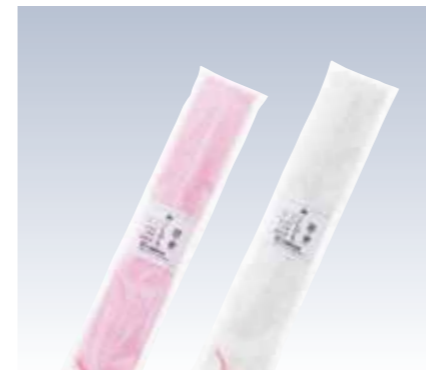
NO.366 本モス腰紐 広幅長尺 (1本入) 素材/毛100% 色/リエーション/2 サイズ/約5×230cm 参考上代 設定なし