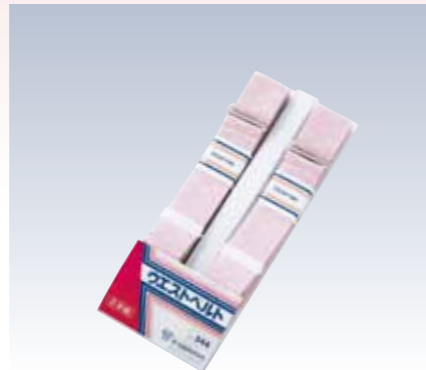
NO.344 2本組腰紐 紐部/織ゴム(レーヨン80%・ポリエステル20%) サイズ/約160×3cm 参考上代 ¥1300(税抜)