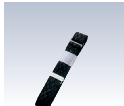
NO.352 ウエストベルト黒 紐部/織ゴム(ナイロン64%・ポリエステル36%) サイズ/約160×3cm 代参考上代 ¥800(税抜)