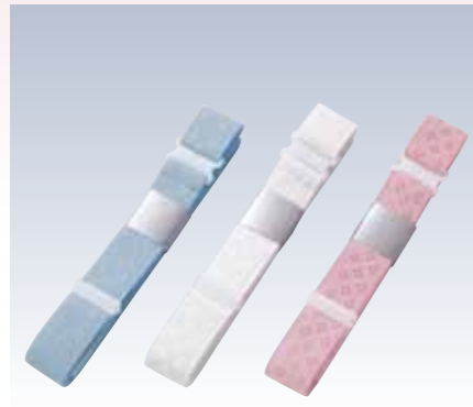
NO.342 好腰紐M NO.350 好腰紐L 紐部/織ゴム(ポリエステル96%・ナイロン4%) 色/リエーション/3 サイズ/M(約160×3cm) L(約180×3cm) 参考上代 M ¥850(税抜) L ¥900(税抜)

ゴムベルトタイプの腰紐は、巻いたあと留め具で留めるだけなので、紐を結ぶ間に下前が落ちてくる心配がなく、初心者にも扱いやすいのが特徴です。留め具が薄いので、表にも響きません。また、胸元を整える胸紐にもなります。