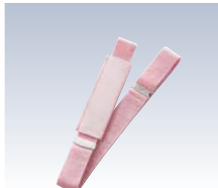
NO.347 コーリン腰紐M NO.348 コーリン腰紐L 紐部/織ゴム(ナイロン70%・ポリエステル15%・ポリウレタン15%) サイズ/M(約145×3cm) L(約170×3cm) 流通梱包数/10×10 参考上代 M ¥1300(税抜) L ¥1400(税抜)