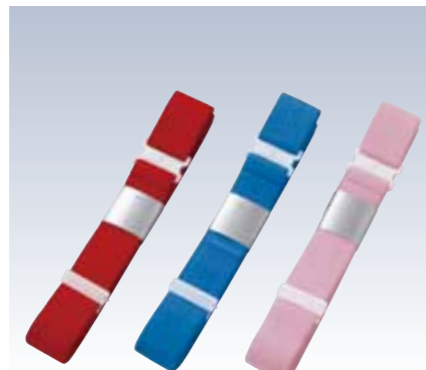
NO.349 DX好腰紐 紐部/織ゴム(レーヨン87%・ポリエステル7%・ナイロン6%) 色/リエーション/3 サイズ/約160×3cm 参考上代 ¥900(税抜)