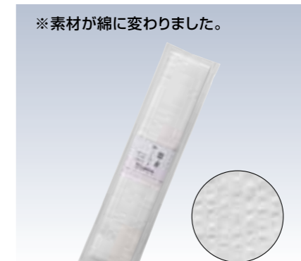
NO.369 縮サッカー腰紐 (1本入) 素材/綿100% サイズ/約5×210cm 参考上代 ¥700(税抜) ※プロの着付師の方に愛用されているタイプ。 緩まずソフトな締め具合が特徴の腰紐です。