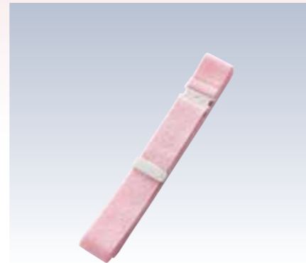
NO.345 コーリンウエストベルトM NO.346 コーリンウエストベルトL 紐部/織ゴム(ナイロン70%・ポリエステル15%・ポリウレタン15%) サイズ/M(約145×3cm) L(約170×3cm) 流通梱包数/10×10 参考上代 M ¥900(税抜) L ¥1000(税抜)