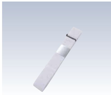
NO.355 ニードル腰紐 紐部/織ゴム(レーヨン80%・ポリエステル20%) サイズ/約160×3cm 参考上代 ¥700(税抜)