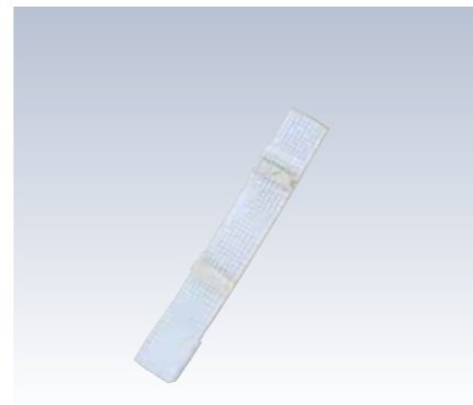
NO.1015 好腰紐メッシュM NO.1017 好腰紐メッシュL 紐部/織ゴム(ナイロン80%・ポリエステル20%) サイズ/M(約145×3cm) L(約170×3cm) 参考上代 M ¥1100(税抜) L ¥1150(税抜)