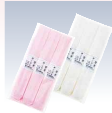
NO.357 本モス腰紐 並幅 (3本入) 素材/毛100% 色/リエーション/2 サイズ/約4×210cm 参考上代 設定なし