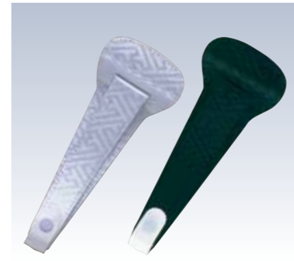
NO.72 止金 リンズ白 NO.73 止金 リンズ黒 表生地/レーヨン100% 芯/スチール・ボール紙 裏生地/レーヨン100% サイズ/約22×8.5cm 流通梱包数/10 参考上代 ¥850(税抜)