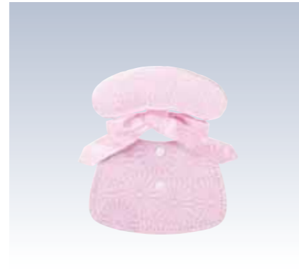
NO.10 サザメ 表生地/レーヨン100% 頭部芯/サンテックフォームポリエチレン 胴体部芯/ボール紙・スチール芯 裏生地/レーヨン100% 紐部/レーヨン100% サイズ/約17×13.5cm 参考上代 ¥1200(税抜) ※半巾帯用