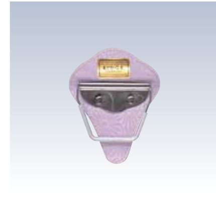
NO.62 止金 まどか 表生地/レーヨン100% 芯/スチール・ボール紙 裏生地/レーヨン100% サイズ/約14×11.5cm 流通梱包数/10 参考上代 ¥1600(税抜)