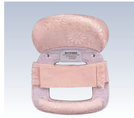
NO.630 教材用 姿 表生地/レーヨン100% 頭部芯/ウレタン 胴体部芯/ボール紙・PVC枠 裏生地/レーヨン100% 紐部/レーヨン100% サイズ/約24×18.5cm 参考上代 ¥2900(税抜)