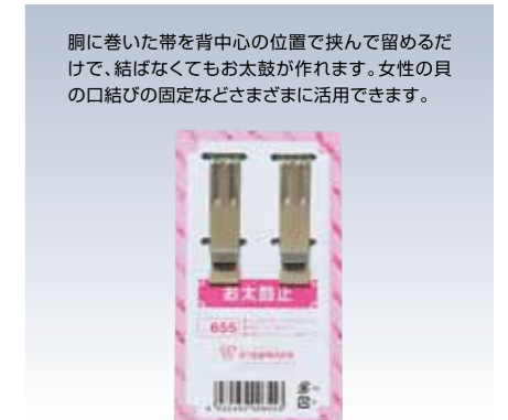
NO.655 お太鼓止 素材/ステンレス サイズ/約5.8×1.3cm 参考上代 ¥500(税抜)

胴に巻いた帯を背中心の位置で挟んで留めるだけで、結ばなくてもお太鼓が作れます。女性の貝の口結びの固定などさまざまに活用できます。