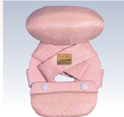
NO.7 コーリン姿 表生地/ポリエステル100% 頭部芯/ウレタン 胴体部芯/ボール紙・ミラーマット・スチール芯 裏生地/レーヨン100% 紐部/ポリエステル100% サイズ/約28×19.5cm 参考上代 ¥3700(税抜) ※頭部取り外し可能(Bタイプ)