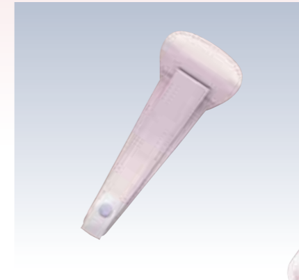
NO.64 止金 ワンタッチ 表生地/レーヨン100% 芯/スチール・ボール紙 裏生地/レーヨン100% サイズ/約22×8.5cm 流通梱包数/10 参考上代 ¥800(税抜)