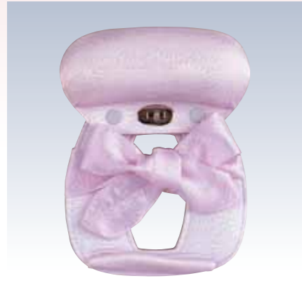
NO.5 M姿 表生地/レーヨン100% 頭部芯/ウレタン 胴体部芯/ボール紙・竹・ミラーマット 裏生地/レーヨン100% 紐部/レーヨン100% サイズ/約26×20cm 参考上代 ¥3000(税抜)

通常の帯結びと違い、お太鼓部分をあらかじめ結帯具にセットして結びます。着付教室で初歩の教材として使われる商品で、後ろに手が上がりにくい方にもお勧めです。帯にやさしく、ふくら雀などの基本的な変わり結びもできます。