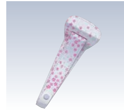
NO.74 止金 小紋 表生地/ポリエステル100% 芯/スチール・ボール紙 裏生地/ポリエステル100% サイズ/約22×8.5cm 色/リエーション/2 流通梱包数/10 参考上代 ¥950(税抜)