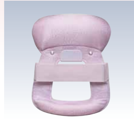
NO.8 ニュー姿 表生地/アセテート100% 頭部芯/ウレタン 胴体部芯/ボール紙・竹・PVC枠 裏生地/レーヨン100% 紐部/ポリエステル100% サイズ/約24×19cm 参考上代 ¥2500(税抜)