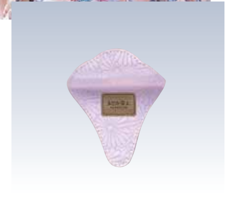
NO.71 止金 まどか金具なし 表生地/レーヨン100% 芯/スチール・ボール紙 裏生地/レーヨン100% サイズ/約14×11.5cm 流通梱包数/10 参考上代 ¥700(税抜)