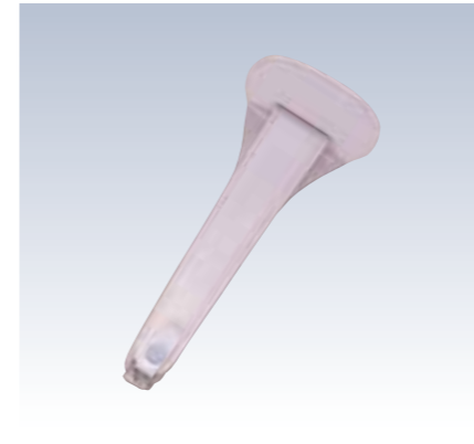
NO.65 止金 S型 表生地/レーヨン100% 芯/スチール・ボール紙 裏生地/レーヨン100% サイズ/約22×8.5cm 流通梱包数/10 参考上代 ¥1000(税抜)