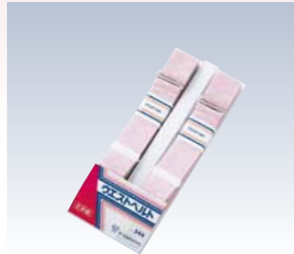
NO.344 2本組腰紐 紐部/織ゴム(レーヨン80%・ポリエステル20%) サイズ/約160×3cm 参考上代 ¥1300(税抜)