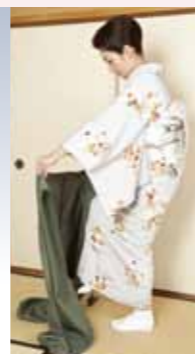
立ったままの着脱可能