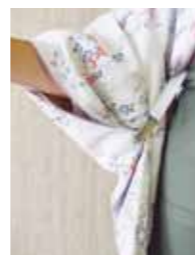
付属のクリップで袴も邪魔にならない。