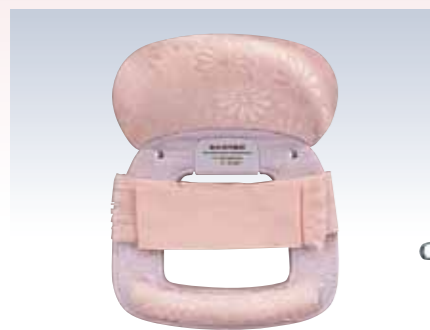
NO.630 教材用姿 表生地/レーヨン100% 頭部芯/ウレタン 胴体部芯/ボール紙・PVC枠 裏生地/レーヨン100% 紐部/レーヨン100% サイズ/約24×18.5cm 参考上代 ¥2600(税抜)

着付け教室で指導用教材として使用されている小物をセレクト。使いやすさと合理性を考慮して作られた商品は、着付け初心者にお薦めのアイテムです。ボディは等身大で、着付けの練習用としてはもちろん、ディスプレイにも便利です。