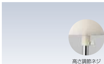
NO.642 着物着付ボディ(1本足) 素材/表生地(ポリエステル63%・綿32%・麻5%) 芯(熱可塑性ポリエチレン樹脂) 高さ/約120~160cm(調節可) サイズ/B約81cm W約62cm H約87cm 参考上代 設定なし ※ピンワーク不可