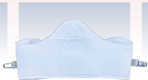
NO.635 教材用ファンデーションM NO.657 教材用ファンデーションL NO.6351 教材用ファンデーションS NO.6571 教材用ファンデーションLL 本体部表生地/綿100% 本体部芯/ウレタンフォーム 裏生地/綿100% 紐部/マジックテープ付ゴム紐 サイズ/S(約62×18cm) M(約68×18cm) L(約75×18cm) LL(約77×18cm) パッケージ/化粧箱入り 参考上代 S/M ¥3800(税抜) L/LL ¥4000(税抜)