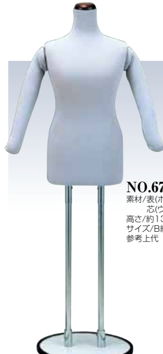
NO.670 着物着付ボディ(2本足) 素材/表(ポリエステル100%) 芯(ウレタン) 高さ/約130~160cm(調節可) サイズ/B約85cm W約75cm H約95cm 参考上代 設定なし