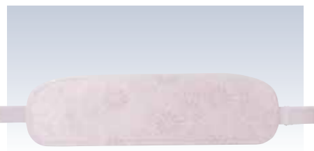
NO.631 教材用前板 大 本体部表生地/アセテート100% 本体部芯/A白ボール 裏生地/レーヨン100%白 ベルト/織ゴム(ポリエステル58%・レーヨン42%) サイズ/約13×44cm 裏ポケット/アウトポケット 流通組数/10 参考上代 ¥1200(税抜) NO.6311 教材用前板 小 サイズ/約13×38cm 参考上代 ¥1100(税抜)