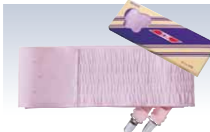
NO.633 教材用伊達メクリップ付 生地/ナイロン100% 芯素材/PVCLゼー芯・不織布 サイズ/約230~245×10cm 参考上代 ¥2800(税抜)