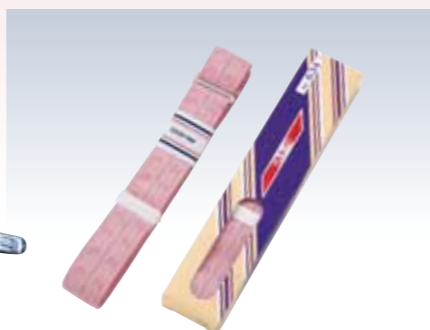
NO.634 教材用ウエストベルトM NO.641 教材用ウエストベルトL 紐部/織ゴム(ポリエステル57%・レーヨン43%) サイズ/M(約160×3cm) L(約180×3cm) パッケージ/化粧箱入り 流通梱包数/10 参考上代 M ¥850(税抜) L ¥900(税抜)