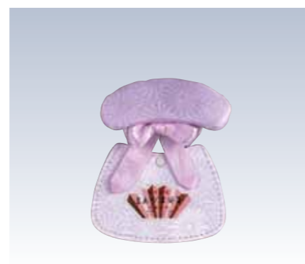
NO.10 サザメ 表生地/レーヨン100% 頭部芯/サンテックフォームポリエチレン 胴体部芯/ボール紙・スチール芯 裏生地/レーヨン100% 紐部/レーヨン100% サイズ/約17×13.5cm 参考上代 ¥1000(税抜) ※半巾帯用