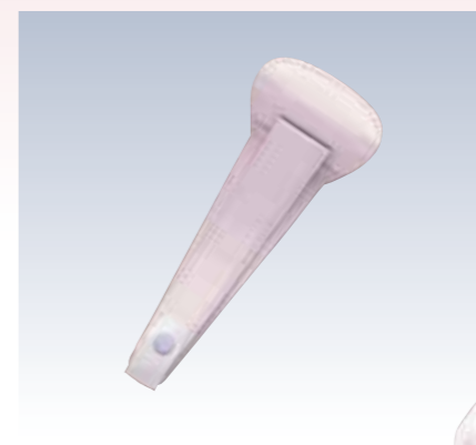
NO.64 止金 ワンタッチ 表生地/レーヨン100% 芯/スチール・ボール紙 裏生地/レーヨン100% サイズ/約22×8.5cm 流通梱包数/10 参考上代 ¥800(税抜)