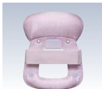
NO.9 下割姿 表生地/アセテート100% 頭部芯/ウレタン 胴体部芯/ボール紙・竹・PVC枠 裏生地/レーヨン100% 紐部/ポリエステル100% サイズ/約24×19cm 参考上代 ¥2600(税抜)