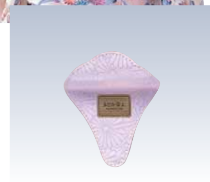
NO.71 止金 まどか金具なし 表生地/レーヨン100% 芯/スチール・ボール紙 裏生地/レーヨン100% サイズ/約14×11.5cm 流通梱包数/10 参考上代 ¥700(税抜)