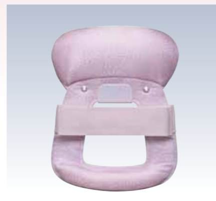
NO.8 ニュー姿 表生地/アセテート100% 頭部芯/ウレタン 胴体部芯/ボール紙・竹・PVC枠 裏生地/レーヨン100% 紐部/ポリエステル100% サイズ/約24×19cm 参考上代 ¥2300(税抜)