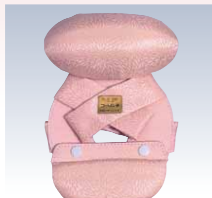
NO.7 コーリン姿 表生地/ポリエステル100% 頭部芯/ウレタン 胴体部芯/ボール紙・ミラーマット・スチール芯 裏生地/レーヨン100% 紐部/ポリエステル100% サイズ/約28×19.5cm 参考上代 ¥3700(税抜) ※頭部取り外し可能(Bタイプ)