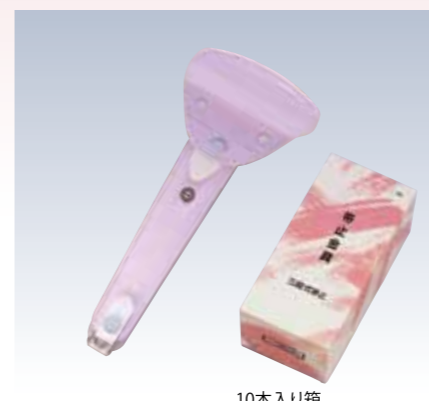
NO.75 止金 3スタイル 表生地/レーヨン100% 芯/スチール・ボール紙 裏生地/レーヨン100% サイズ/約22×9cm 流通梱包数/10 参考上代 ¥1400(税抜)

便利な止金具を使えば、帯を結ぶ必要がないため、帯を傷める事なく、やや硬い素材のものもラクに扱いやすくなります。上部の受け部分に帯枕をのせる事ができるので、お太鼓が下がることなく、美しい結び上がりが保てます。