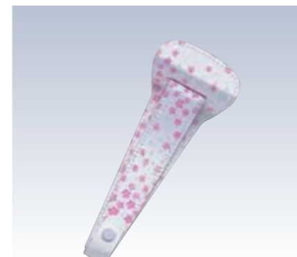
NO.74 止金 小紋 表生地/ポリエステル100% 芯/スチール・ボール紙 裏生地/ポリエステル100% サイズ/約22×8.5cm 色/イエロー/2 流通梱包数/10 参考上代 ¥950(税抜)