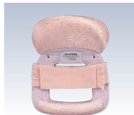
NO.630 教材用 姿 表生地/レーヨン100% 頭部芯/ウレタン 胴体部芯/ボール紙・PVC枠 裏生地/レーヨン100% 紐部/レーヨン100% サイズ/約24×18.5cm 参考上代 ¥2600(税抜)

お太鼓部分を、この結帯具にセットすることで、帯を手早く結ぶことができます。帯にやさしく、また基本的な変わり結びも結べます。