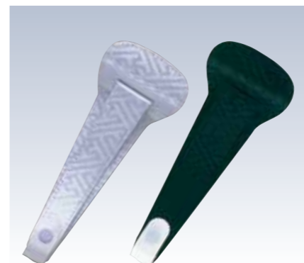
NO.72 止金 リンズ白 NO.73 止金 リンズ黒 表生地/レーヨン100% 芯/スチール・ボール紙 裏生地/レーヨン100% サイズ/約22×8.5cm 流通梱包数/10 参考上代 ¥850(税抜)