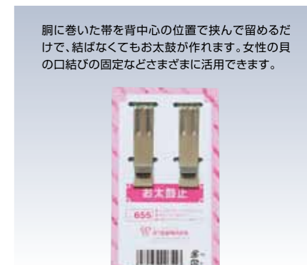
NO.655 お太鼓止 素材/ステンレス サイズ/約5.8×1.3cm 参考上代 ¥500(税抜)

胴に巻いた帯を背中心の位置で挟んで留めるだけで、結ばなくてもお太鼓が作れます。女性の貝の口結びの固定などさまざまに活用できます。