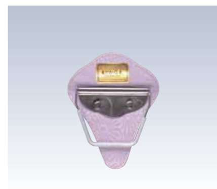
NO.62 止金 まどか 表生地/レーヨン100% 芯/スチール・ボール紙 裏生地/レーヨン100% サイズ/約14×11.5cm 流通梱包数/10 参考上代 ¥1400(税抜)