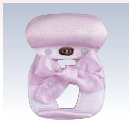
NO.5 M姿 表生地/レーヨン100% 頭部芯/ウレタン 胴体部芯/ボール紙・竹・ミラーマット 裏生地/レーヨン100% 紐部/レーヨン100% サイズ/約26×20cm 参考上代 ¥2800(税抜)

通常の帯結びと違い、お太鼓部分をあらかじめ結帯具にセットして結びます。着付教室で初歩の教材として使われる商品で、後ろに手が上がりにくい方にもお勧めです。帯にやさしく、ふくら雀などの基本的な変わり結びもできます。