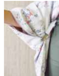
付属のクリップで袴も邪魔にならない。