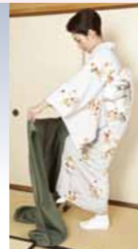
立ったままの着脱可能