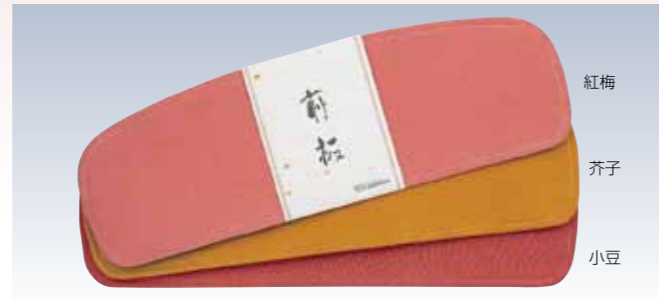
NO.280 前板正絹チリメン

※天然素材(松)を使用した手作りの為、 大きさ・硬さに多少のバラつきが生じます。