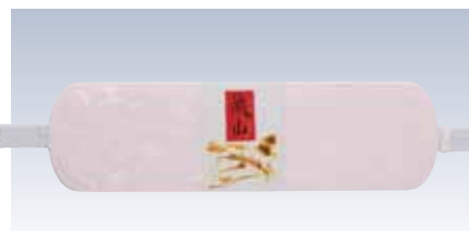
NO.208 前板ベルト付嵐山

本体部表生地/ポリエステル100% 本体部芯/ポリエチレン樹脂 裏生地/レーヨン100%白 サイズ/約14×47cm 裏ポケット/アウトポケット 流通組数/10 参考上代 ¥1400(税抜)