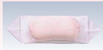
NO.108 帯枕ソフトガーゼ嵐山

本体部表生地/ポリエステル100% 本体部芯/ウレタンフォーム 裏生地/綿100%バイル地 紐部/織ゴム(レーヨン72%ポリエステル22%ナイロン6%) サイズ/約77×20cm 参考上代 ¥3800(税抜)