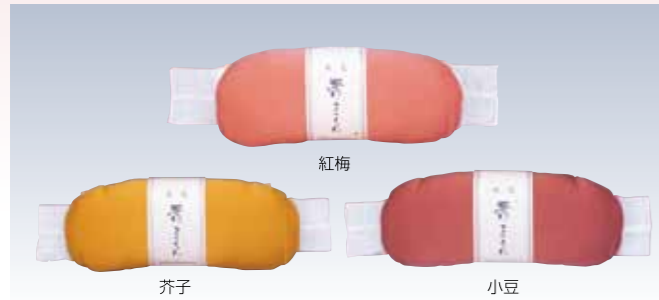
NO.180 帯枕木毛正絹チリメン(ガーゼ紐)

絹の良さとお高級感を活かした、正絹シリーズ。帯枕は、木毛芯で最適な固さ。さらにガーゼ紐なので体にフィットします。前板はボール芯で帯に張りを与え、サイズも普段着から訪問着まで幅広くOK。また、正絹生地は帯を摩擦から守ります。