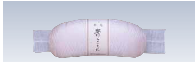
NO.181 帯枕木毛正絹サヤ(ガーゼ紐)

本体部生地/絹100% 本体部芯/A白ボール 裏生地/レーヨン100%サヤ柄 サイズ/約13×41cm 色バリエーション/3 同柄帯枕/NO.180 裏ポケット/内ポケット 参考上代 ¥2100(税抜)