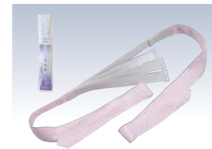
NO.681 三重仮紐 脱着タイプ

素材/ゴム(ポリエステル100%) 紐(ポリエステル100%) サイズ/約3×148cm(ゴム幅2cm) 参考上代 ¥700(税抜) ※振袖用に多い黒地の帯に、目立たないので便利です。