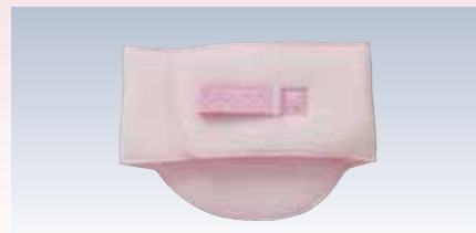
NO.98 ソフトパット嵐山

帯枕、前板、伊達締めなどを、同じ柄で揃えたいという方のためのグレードアップ小物が、嵐山シリーズです。淡いピンク色で統一したデザインは、フォーマルにも普段使いにも使えて、おしゃれ心を満たしてくれるでしょう。